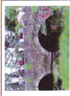
Le Pont de Péplu à Rocheservière

Cartes préconisées : Michelin 316 Local IGN série bleue