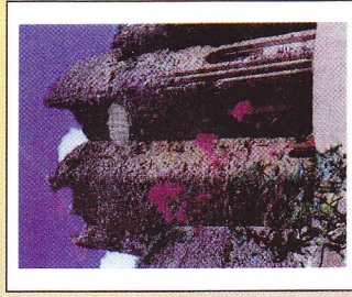
Le Château de Talmont